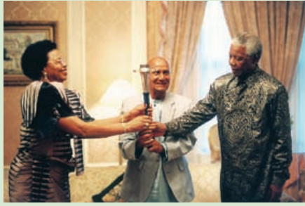
Nelson Mandela, former President of South Africa, and his wife Mama Graza Machel with Sri Chinmoy.