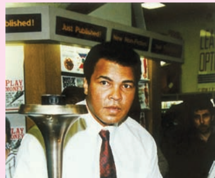
Muhammad Ali, world renowned boxing great, reflects on harmony.