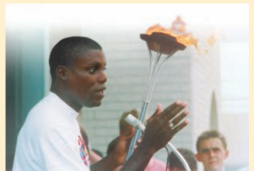
Nine-time Olympic gold medalist Carl Lewis speaks about the goals of the Run.