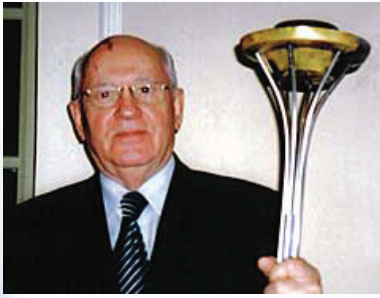
Former Soviet President Mikhail Gorbachev holds the torch.