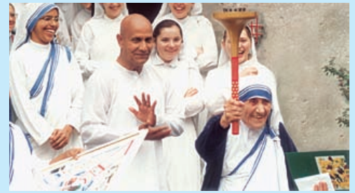
Mother Teresa and Sri Chinmoy celebrate the spirit of harmony.

提唱者シュリ・チンモイとトーチを掲げるネルソン・マンデラ元南アフリカ大統領とグラサ・マシェル夫人