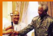
Nelson Mandela bývalý prezident Jihoafrické republiky