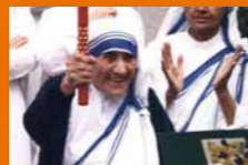
Matka Tereza zakladatelka řádu pečujícího o chudé a nemocné

Bežet s pochodní či s ní ujít jen pár kroků a vložit do ní své přání pro lepší svět může každý. Mnoho významných osobností z celého světa se právě tímto způsobem každoročně připojuje k této výjimečné štafetu.