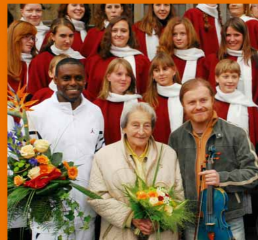
Carl Lewis devítinásobný olympijský vítěz