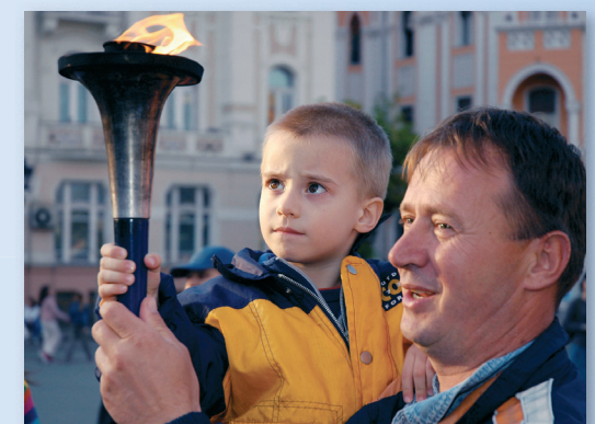
Děti – zítřejší tvůrci světa: World Harmony Run přináší poselství míru a přátelství žákům a studentům v tisících školách po celém světě.

Připojit se můžete také na internetu, kde každý den zveřejňujeme fotografie a příběhy z trasy po celém světě. Pro informace o trase a časovém harmonogramu navštivte naši stránku www.worldharmonyrun.cz .