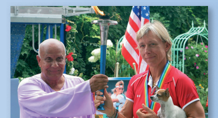
Česká tenistka Martina Navrátilová projevuje svou podporu štafety World Harmony Run