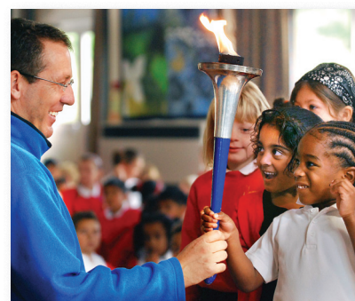
Každý si může pochodně podržet.