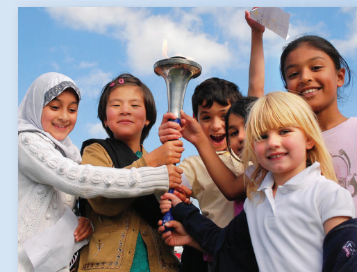
Jednota v rozdílnosti: všichni jsme členy jedné světové rodiny.

Atlet, filozof, výtvarný umělec, hudebník a básník Sri Chinmoy zasvětil svůj život ideálům světového přátelství a jednoty.