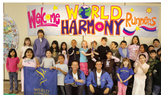
Prostřednictvím programů ve školách a dětských domovech učí mezinárodní běžci World Harmony Run o přátelství, kulturní různorodosti a vytváření míru.