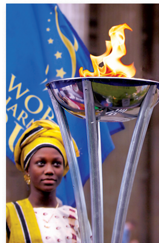
Pochodeň harmonie přináší naději lidem všech národů.

Připojte se i vy – poponeste pochodně několik kroků nebo si ji jen na chvíli podržte a vložte do ní své osobní přání pro harmonii mezi lidmi a národy. Jediné, co vás to bude stát, je vaše rozhodnutí udělat krok pro světovou harmonii.