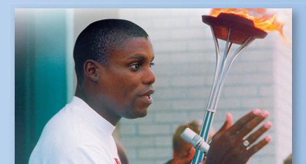
Devítinásobný olympijský vítěz Carl Lewis mluví o myšlenkách běhu.