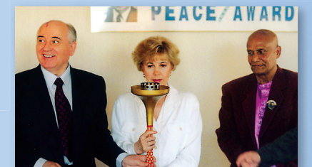
Bývalý sovětský prezident Michail Gorbačov a jeho žena Raisa Maximovna s pochodní harmonie při setkání se Sri Chinmoyem.