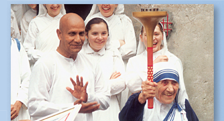
Matka Tereza podpořila běh modlitbou za harmonii ve světě.