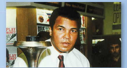
Muhammad Ali, světově proslulý boxer, s pochodní harmonie.