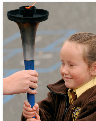
Přání pro světový mír.