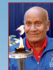
Sri Chinmoy zakladatel 1931-2007